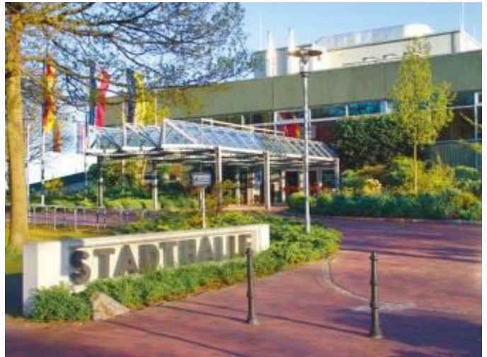
Veranstaltungsort: Stadthalle Eckernförde